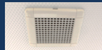
シロッコファンによる強力な換気システム