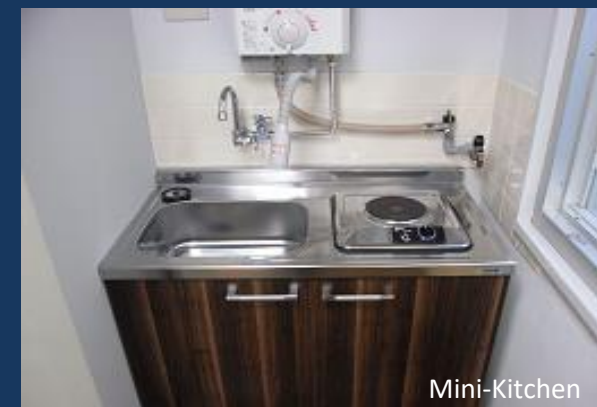
200V電源、ガス利用、電磁コンロの利用可能